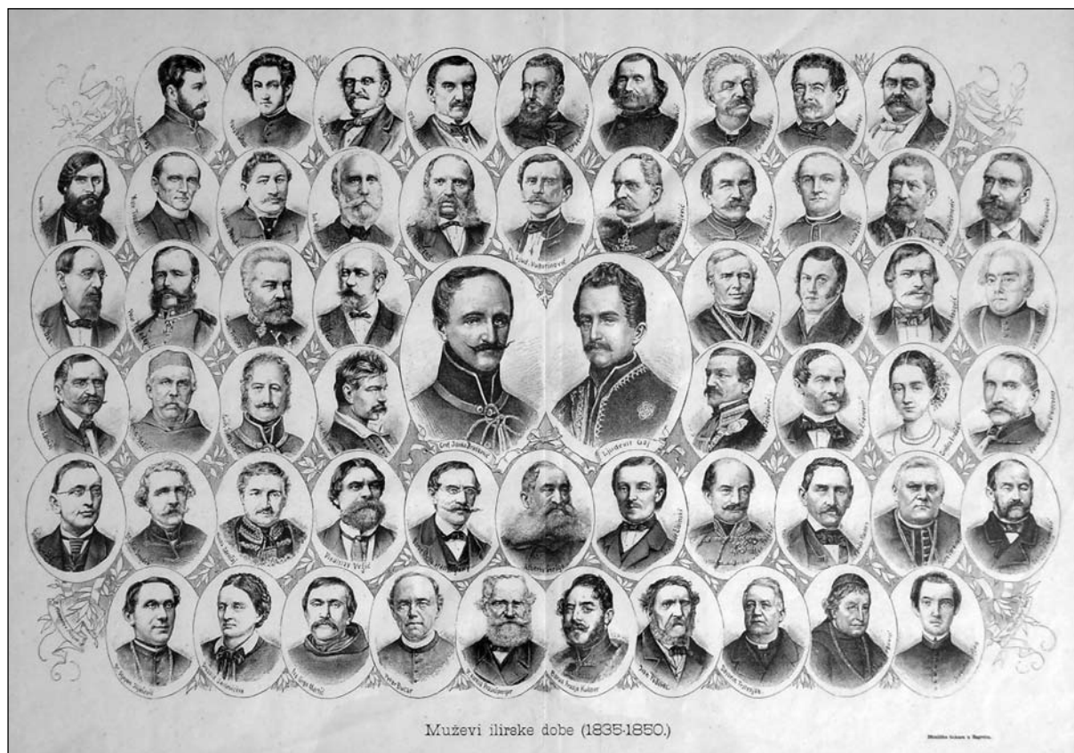
Možje ilirske dobe (1835-1850). Kajkaviana.

dobro kot očetje. 14 Kakorkoli, Drašković je zaključil, da uspeh preporodnega gibanja ne bo umanjkal, če ga bodo le podprle ženske. Ženske je zato laskavo pozval, naj podprejo narodno stvar. 15 Tudi iz zaključnega dela Draškovićevega spisa, v katerem je govoril o novem pravopisu – gajici in potrebi po razvoju enotnega knjižnega jezika –, je jasno, da žensk ni dojemal kot povsem neizobražene. 16