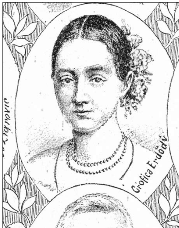
Sidonija Rubido Erdödy. Detajl grafike Možje ilirske dobe.